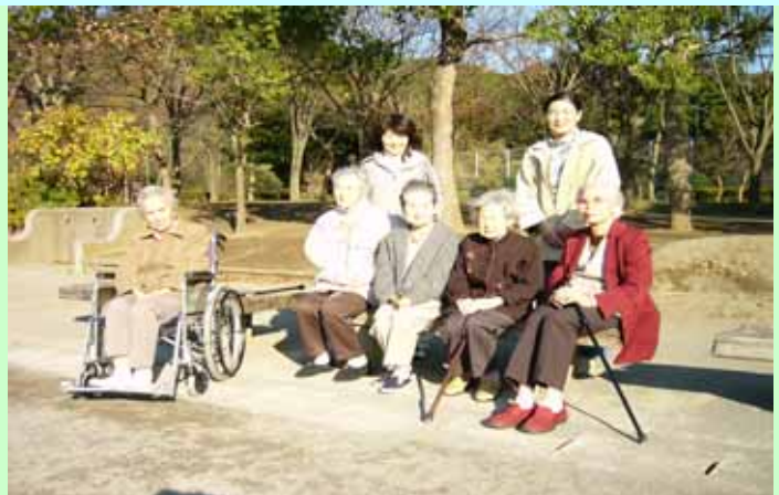
冬の陽だまり 南郷公園の散策

グループホーム「櫻」運営推進会議資料の公開について地域密着型施設として運営推進会議開催結果を公表する事になっており、「櫻」としてもHP上で公開をしておりますが議事録のほか資料も一緒に載せております。活動状況の一つとして毎月発行の「さくら」掲載する事になりました。個人情報保護法の観点から検討いたしました。個人を特定するに至らないと判断し掲載写真の公表に至りました。市内の文化施設や商店等を利用して普段の生活でも一般市民との交流を図っている状況を鑑み、必要最小限の情報として公開いたしますので、ご家族の皆様方のご理解ご了承を賜りたくお願い申し上げます。なお、「櫻」のホームページは医療法人社団柏信会青木病院にアクセスして頂ければ閲覧できます。