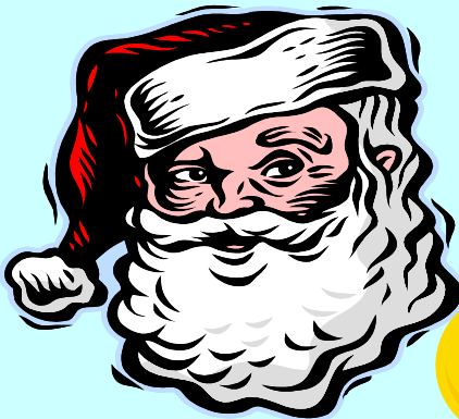
メリークリスマス