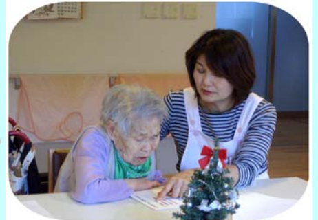
これなーに (スタッフも教えられ)