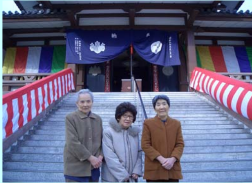
(初詣: 逗子大師延命寺にて)