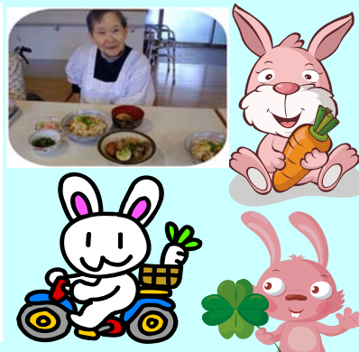
(来年のウサギも駆けつける)