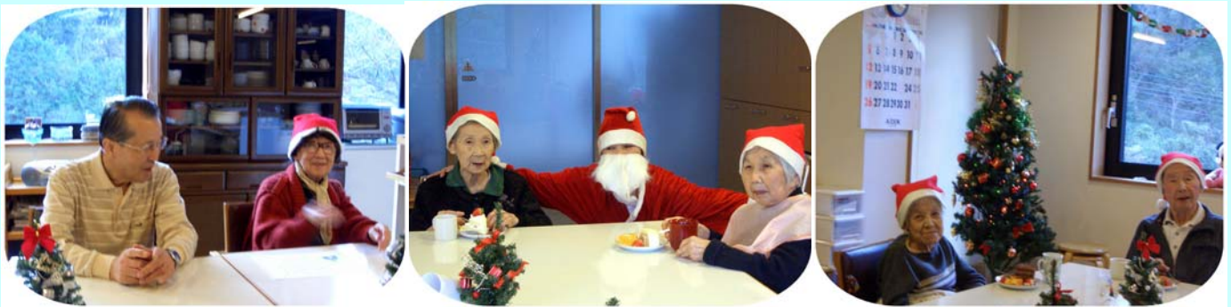
(ボランティアの歌とお話、ささやかなクリスマスを静かに楽しむ皆さんでした。)