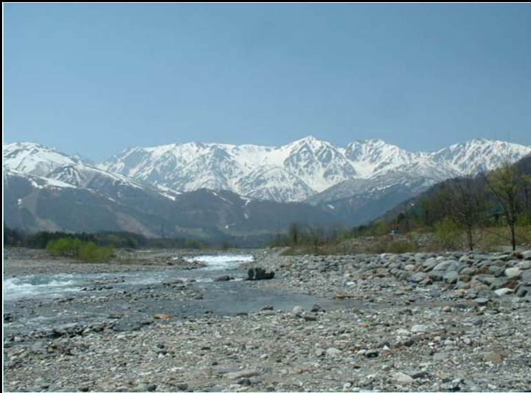
(早春の白馬三山:これからは雪形が現れる季節)