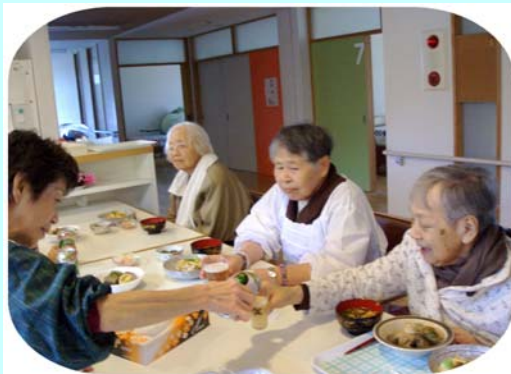
(忘年会手作り料理でいざ乾杯)