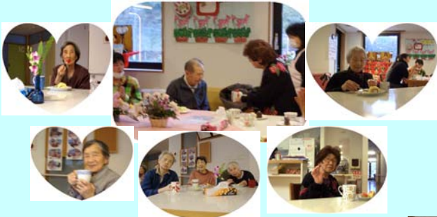
(お誕生会:皆さんから祝福されてご満悦)

スタッフの苦勞もご利用様の笑顔で報われます。梅に水仙、河津櫻と咲き競い、本番の桜も月末には咲きだし、ご利用様もアウトドアの季節を迎えます。春を堪能できるようスタッフも頑張っております。