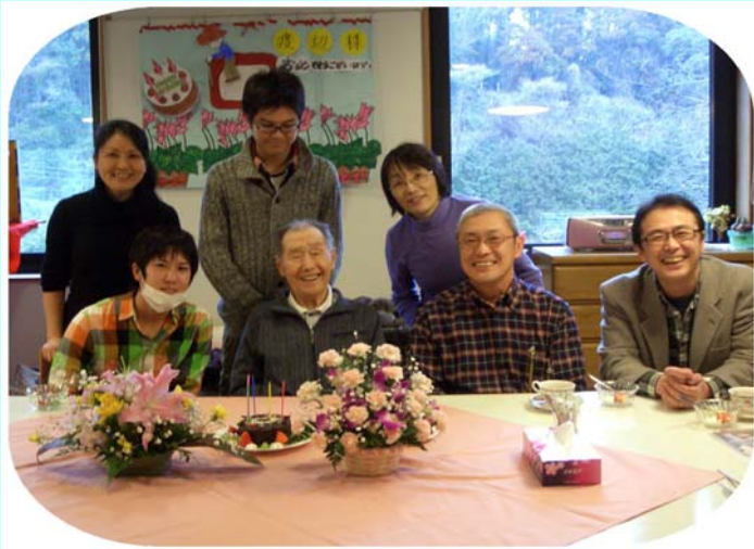
(やっぱり欲しいこの笑顔)