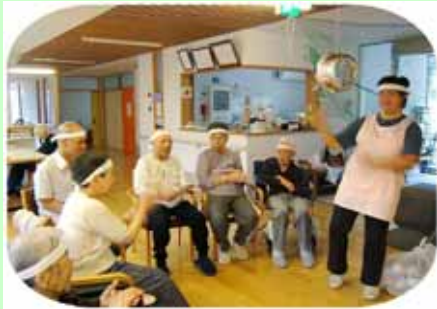
(クス玉割り:うまく割れるかな?)

インフルエンザ予防接種の実施について 先にご案内を差し上げたところでございますが、お届け期日までに1名の不実施の連絡を受けた他は、ご連絡がございませんでしたので時機を見て実施させていただきますのでご了承ほどお願い致します。