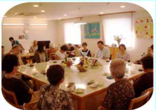
(2F ご家族と職員の懇談)