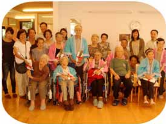
(2F 敬老会ご家族とご一緒に)