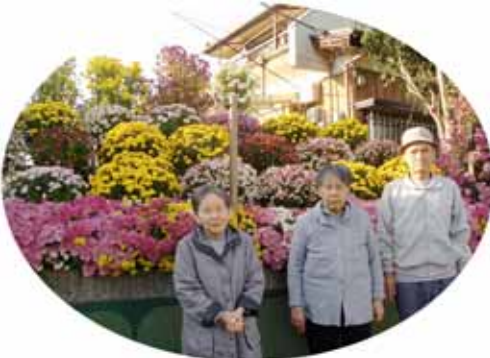
(南郷公園の銀杏の黄葉を楽しみ、菊愛好家ご自宅の菊を觀賞させて頂く)