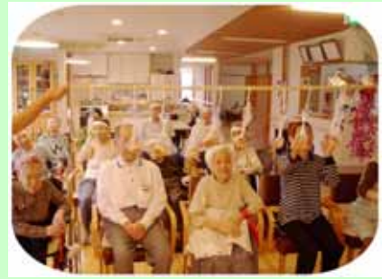
(一番人気のパンくい競争)

櫻の秋季室内大運動会? : 2ユニット合同で和気あいあい、皆さんそれぞれの競技を楽しまれました。