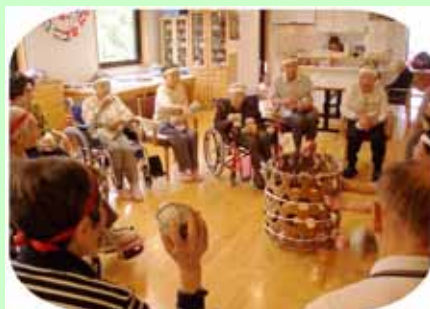
(玉入れ:座っては少し難しい?)