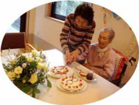
(誕生会・スタッフ手作りケーキに入刀)

3 個室備品等について 最近要介護度が高くなり転倒、落下の危険度が高くなり職員一同腐心している処ですが、ご家族様とご相談安全確保に努めて行きたたく日々努力している処です。つきましては、それらに付随した資機材の備え付けには事前にご遠慮なくご相談を頂くようお願い致します。