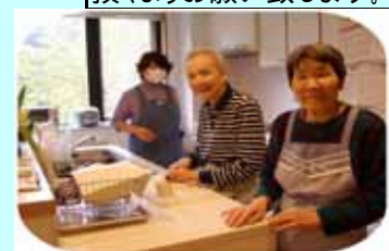
(調理はお任せのポーズ)