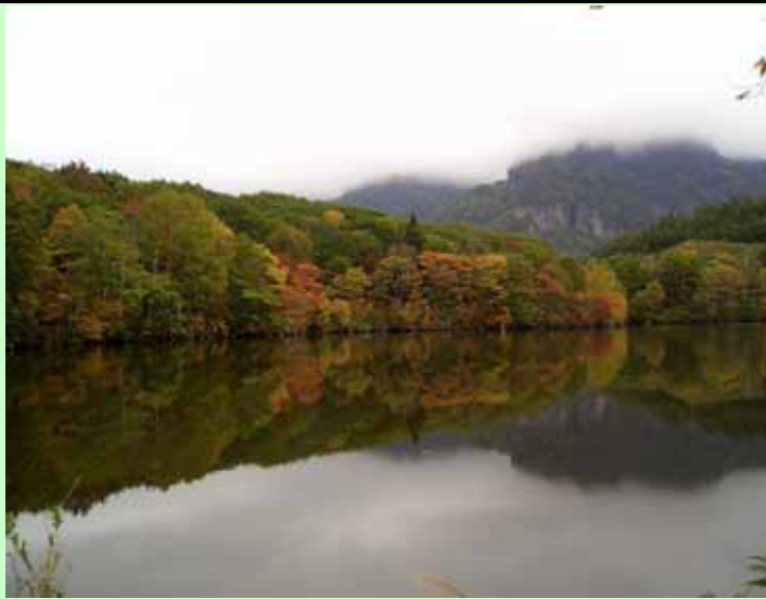
(戸隠高原は鏡池 紅葉は始まったばかり : 10月中旬撮影)

一に雇用、二に雇用有言実行内閣が聞いて呆れる、問題は全て先送り。円高に打つ手もなく、企業は海外、日本空洞化。失業者は増えても雇用先無し。暇な議員は仕分けで税金の無駄使い。やれやれ。ご家族の皆様にはお変わりなくお越しの事とご推察申し上げます。