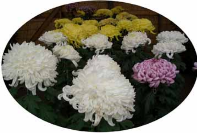
( 彼岸過ぎ 氷雨に変わり 衣替え )

国連総会も演説の間に退席され聞く人もまばらな会場で演説する姿は哀れなり。尖閣列島では中国に足元をみられその恫喝に慌てふためく姿。