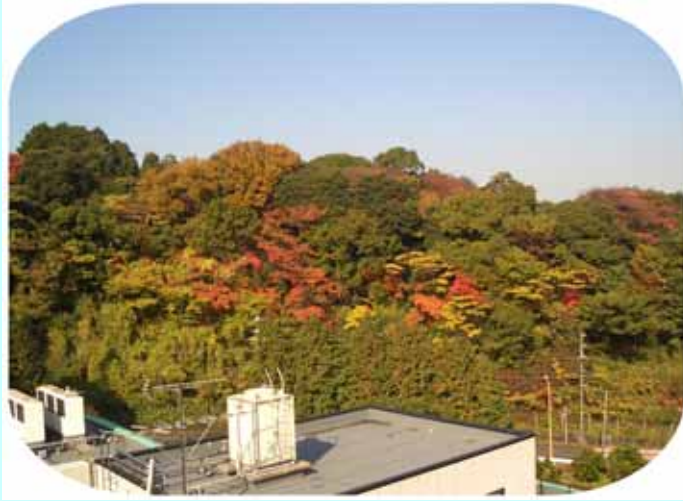
(櫻の前山も紅葉が始まりました。)