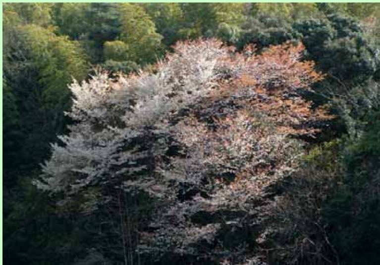
(桜花爛漫の下 酒宴も良いが山間の桜も春の風情あり)