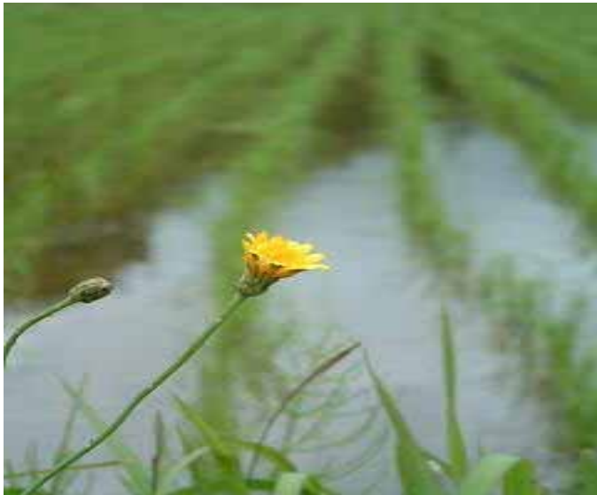
(畦道のタンポポ絵になる青田かな)