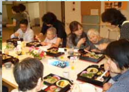
(散策が終わって櫻で会食)