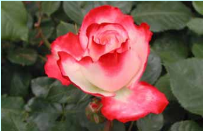
(横須賀港はベルニー公園のバラ)

沖縄の民意を悪戯に逆なでするような総理の発言や平和ボケの某大臣発言。選挙目当てに国民を欺く愚策におぼれる現政権。朝鮮半島の緊張が高まる中で、ノー天気な内閣で日本の安全は保障されるのだろうか。この8ヶ月何一つマニフェストどおりに実行されたものはない。