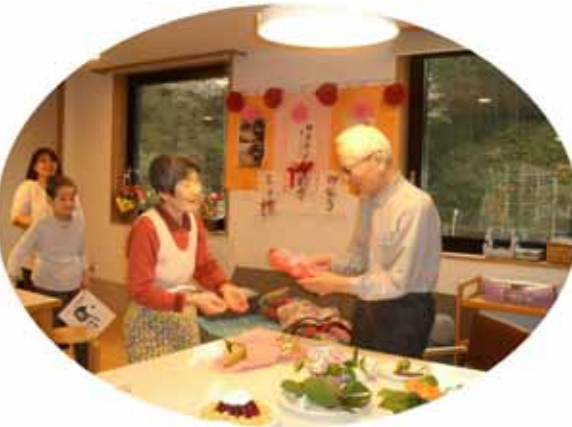
(お誕生会幾つになっても嬉しいものです。) 1F:黒1点?女性軍からのプレゼントに大満足の様子でした。

国民の支持率も急落、同盟国からも信頼されずに政治と金の問題を背負って、政治的パフォーマンス事業仕分けでお茶を濁す我等が首相。折角収まっていた蜂の巣(沖縄)を引っ掻き回して民意の尊重どころか開き直りに似た昨今の言動は権力の座にしがみつくと哀れな操り人形と化した。民主党は泥舟、自民党はタンポポの綿毛、風に吹かれ、何処に根付くか。どこぞの將軍様の独裁政治に似てきた今の日本を救ってくれるのは誰か。暗い政治の話はさておき、五月晴れ新緑の季節はゴールデンウィークと共にやってきました。ご家族の皆様には如何お過ごしでしょうか。ご利用者の皆様も屋外に出る機会も多くなり薫風を思い切り肌で感じながら元気にお過ごしです。櫻も、お蔭様で開設6年目に入りました。スタッフ一同初心忘れずサービスの質的向上を目指し頑張て参りたいと思いますのでご協力宜しくお願い致します。