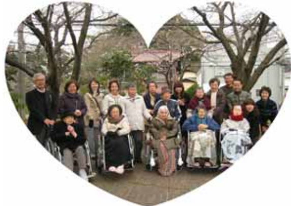
(梅は咲いたが桜はまだだった。) 2Fの皆さんご家族とご一緒の花見も寒かったようです。残念”でした。