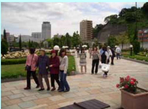
(横須賀ベルニー公園散策)