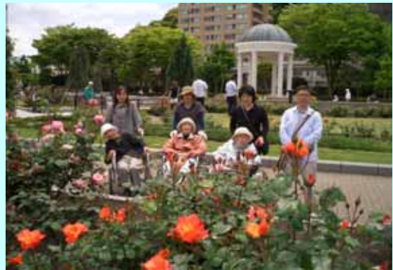
(バラの花と香りに大満足)