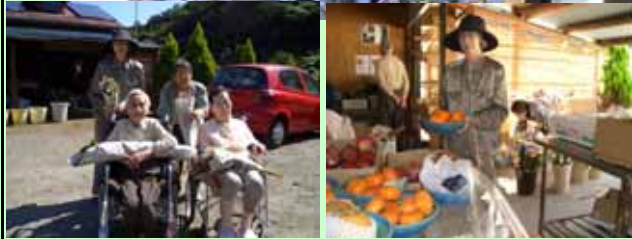
(八百屋さんで何を買いました?)