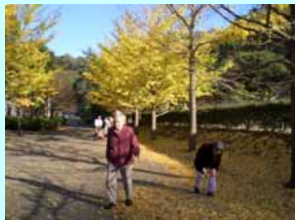
(南郷公園の落ち葉拾い)