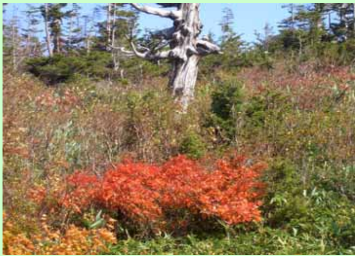
(晩秋の彩り:八幡平)

霊峰富士も白雪を頂に早や冬支度の今日この頃 ご家族の皆様には如何お過ごしでしょうか。 櫻の皆様もお元気で日々を送られております。 新型インフルエンザの流行、季節型インフルエンザ の時期となりスタッフもご利用者の体調管理等に 細心の注意を傾注しておりますが、何分にもご高齢 時折体調を崩される方も居られます。