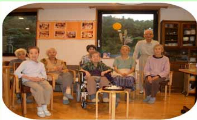
(月々に月見る月は・・・お月見と小運動会に勢ぞろい)