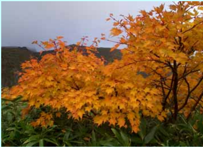
(秋名残り 栗駒山の楓かな)

ご家族の皆様にはその後いかがお過ごしでしょうか。ご利用者の皆様の生活の一部を写真でご紹介致します。これからはクリスマスやお正月など、楽しい行事が沢山予定されスタッフもいろいろと趣向をからした計画作りに努めております。