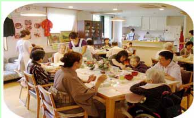
(ご家族と一緒に一番の笑顔)