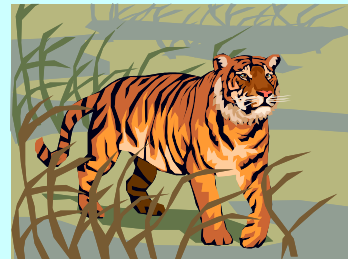
明るい寅年 ウオー

激動の年、十大ニュースが紙面を賑わし今年も暮れようとしております。ご家族の皆様には大変お世話なりスタッフ一同感謝申し上げます。来年も一生懸命頑張りますので宜しくお願い申し上げます。少し気が早すぎますが、この紙面をお借りしてご挨拶とさせていただきます。