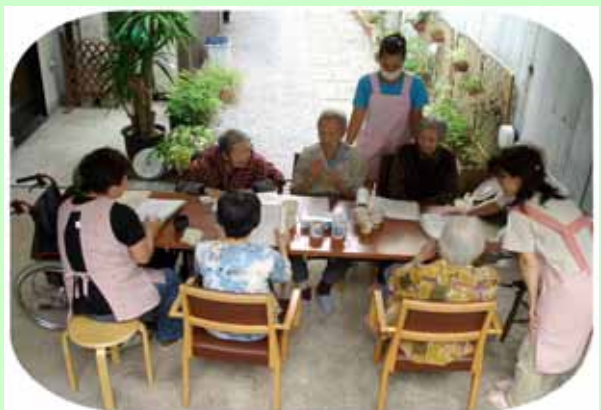
(1Fの皆さん:植木を眺めてティータイム)

さて、新型インフルエンザの蔓延は既にメディアで報じられご承知のことと存じますが、ワクチン接種等について具体的な通知はありません。状況が判明次第ご連絡いたしますが、櫻と致しましては季節型の準備をして新型のリスク予防を図りたいと存じます。同封お知らせについて宜しくお願い致します。