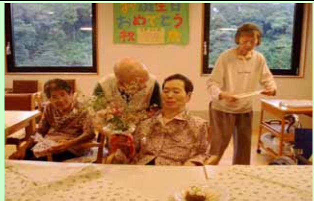
(お誕生会:花束の贈呈)