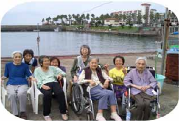
(2Fの皆さん:小坪漁港のティータイム)

高い山々から紅葉の便りが届く今日この頃ですがご家族の皆様にはお変わりなくお過ごしのことと存じます。先般は敬老会へご出席頂き有難うございました。ご利用者皆様の嬉しそうな笑顔にスタッフも企画した苦労も報われた思いが致しました。