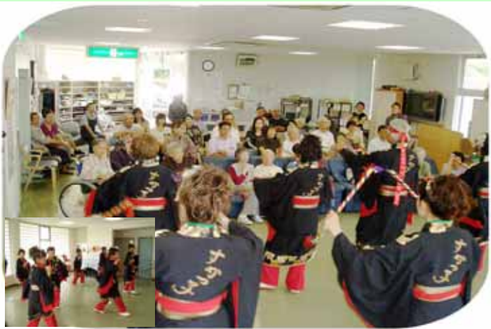
(よさこい踊りと軽快なリズムを楽しむ)