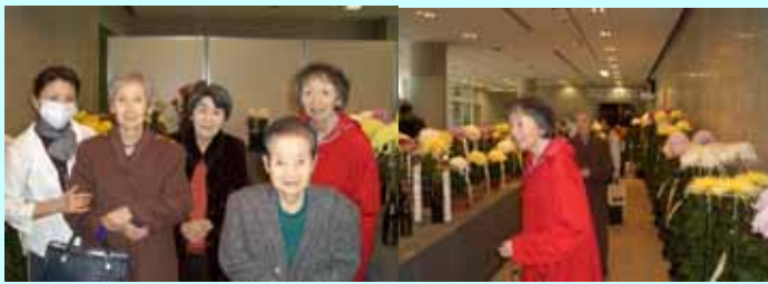
(逗子市文化祭恒例の菊の展示会場にて)

その結果については、「さくら」又はホームページでお知らせいたしますので是非ご覧頂きたいと思致します。