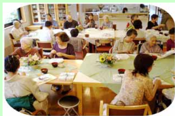
(ご家族と賑やかに食事)